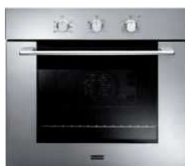
Ugradbena pećnica: SM 52 MX