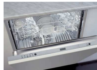
Ugrad.per.posuđa: DW 612 AS