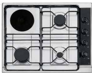
Ugradbena ploča: PCI 4 3 GAV