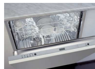
Ugrad.per.posuđa: DW 612 AS